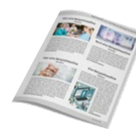
1/4 Seite Eck Inkl. 1 Bild 700 Zeichen Text 800 €