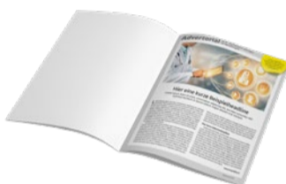
1 Seite Inkl. 1 großes Bild 2.700 Zeichen Text 2.200 €