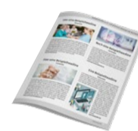
1/4 Seite Eck Inkl. 1 Bild 700 Zeichen Text 820 €