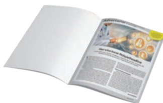
1 Seite Inkl. 1 großes Bild 2.700 Zeichen Text 2.250 €