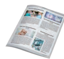
1/4 Seite Eck Inkl. 1 Bild 700 Zeichen Text 820 €

Bitte fordern Sie unser Informationsblatt mit weiteren Gestaltungsbeispielen an: selzer@zweiplus.de | 06151-8127-200