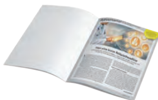
1 Seite Inkl. 1 großes Bild 2.700 Zeichen Text 2.250 €